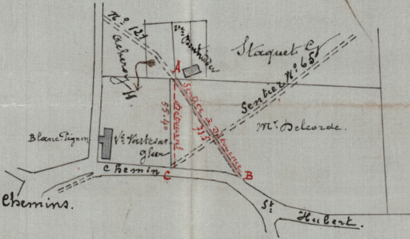
Extrait de l'Atlas des Chemins.

N.B. La partie AB du sentier serait placée en AC. Par suite de ce changement le sentier est mesuré de 18 m 10 et la surface gagnée est de 18.10 x 1.65 = 29 centiares 86 100 / m C.H.